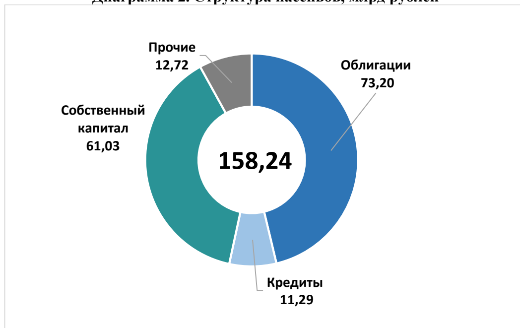
Диаграмма 2. Структура пассивов, млрд рублей