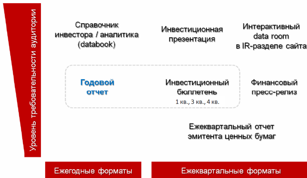
Рисунок 1. Ключевые форматы добровольного и обязательного раскрытия информации.

Форматы добровольного информационного раскрытия должны дополнить обязательное раскрытие, сформировав завершующую систему коммуникаций эмитента с внешним миром (см. рисунок 1).