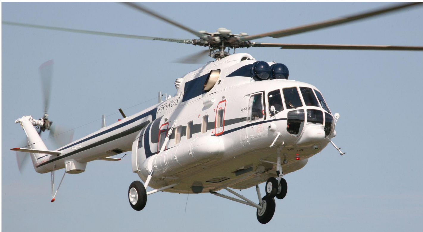
Вертолет Ми-171А сертифицирован в России и Бразилии.

Вертолет Ми-171А1 является дальнейшей разработкой семейства вертолетов Ми-171. Он создавался для использования в первую очередь в сфере гражданской авиации, поэтому особое внимание при его разработке было уделено вопросам безопасности и сертификации.