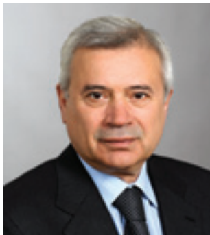
АЛЕКПЕРОВ Вагит Юсуфович, Президент ОАО «ЛУКОЙЛ»

Открытое акционерное общество «Нефтяная компания «ЛУКОЙЛ» (далее также ОАО «ЛУКОЙЛ», Компания, ЛУКОЙЛ) последовательно движется к намеченным целям – укреплять позиции одного из лидеров нефтегазовой отрасли мира, стать глобальной энергетической компанией, соответствовать высочайшим требованиям в области охраны окружающей среды, труда и здоровья.