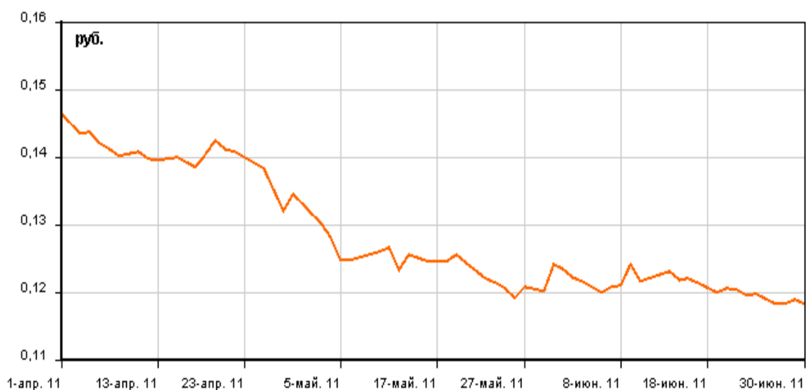
Динамика цены 1 акции ОАО «МРСК Юга» за 2 квартал 2011 г. (по данным ЗАО «ФБ ММВБ»)