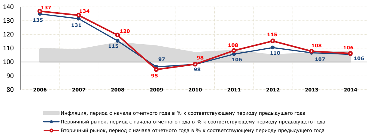
Рисунок 3 – Динамика индексов цен на жилье на вторичном и первичном рынках в 2006–2014 гг., %

Индекс рассчитывается как отношение индекса цен на рынке жилья (первичный/вторичный рынок) к реальным располагаемым денежным доходам населения. Уменьшение значений показателя свидетельствует об увеличении доступности жилья.